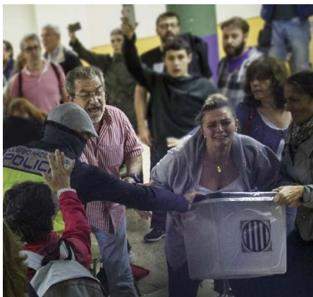
Repressió policial en el referèndum de l'1 d'octubre

Me hacen gracia, por ser absurdos, los llamamientos de las autoridades españolas a cumplir la Constitución. No existe ninguna constitución en el mundo que incluya un artículo que permita la secesión de una de sus partes. Con ese argumento falso se niega el derecho del pueblo catalán a independizarse si ésta es su voluntad mayoritaria.