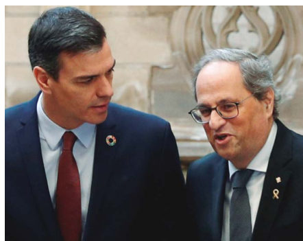
El president del Gobierno, Pedro Sánchez, i el de la Generalitat, Quim Torra, s'han compromès a posar en marxa la taula de diàleg entre Governos